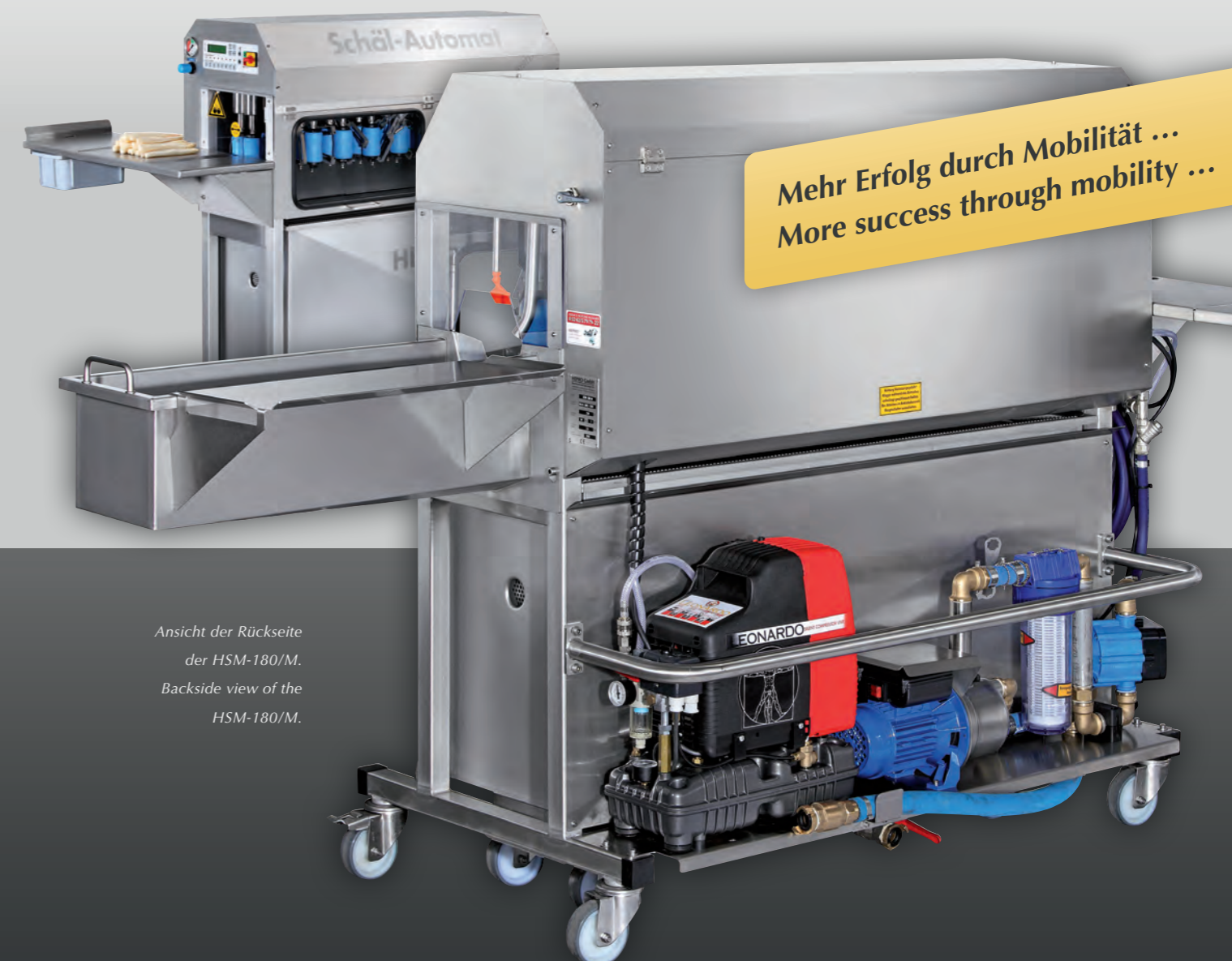
Ansicht der Rückseite der HSM-180/M. Backside view of the HSM-180/M.